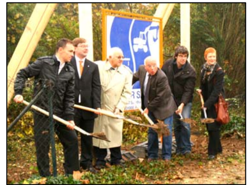
Erster Spatenstich im Neubaugebiet „Am Biegen“ in der Gemeinde Oftersheim

Dies nutzt auch die Nachbargemeinde Plankstadt. Für das im Vergleich zum Schwetzinger Baugebiet insgesamt fünffach größere Neubaugebiet „Bruchhäuser Weg“ wurden bereits mit Beginn der Baumaßnahmen in 2008 Vorauszahlungsbescheide erstellt. Nun steht auch dort mit dem Bauende im November 2009 die Abrechnung der öffentlich-rechtlichen Baumaßnahme und der Versand der endgültigen Beitragsbescheide durch die BauLand! Entwicklung GmbH an.