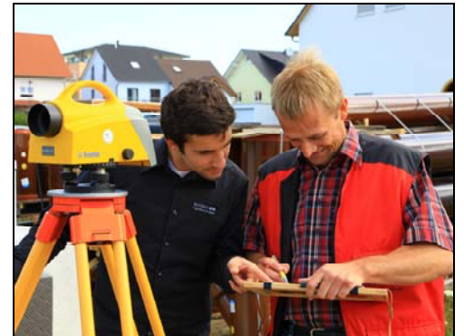
Bauingenieur und Vermessungsingenieur arbeiten gemeinsam an einem Bauprojekt