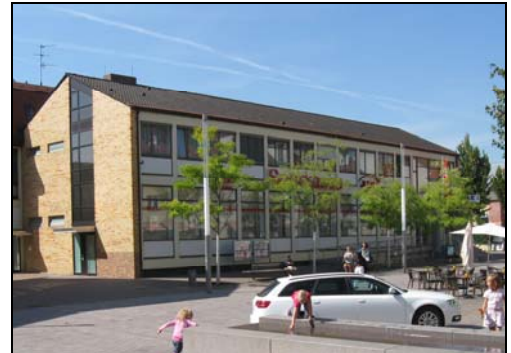
Der alte Sparkassen-Bau an den Kleinen Planken